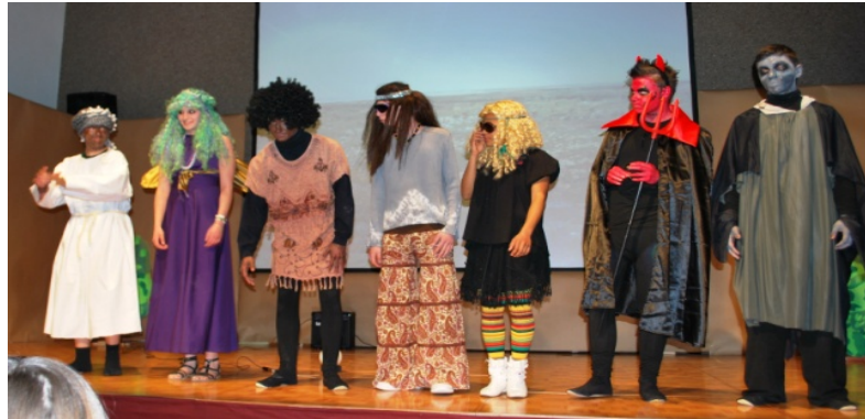
Theater Schülerinnen und Schüler Frühlingsfest 2011